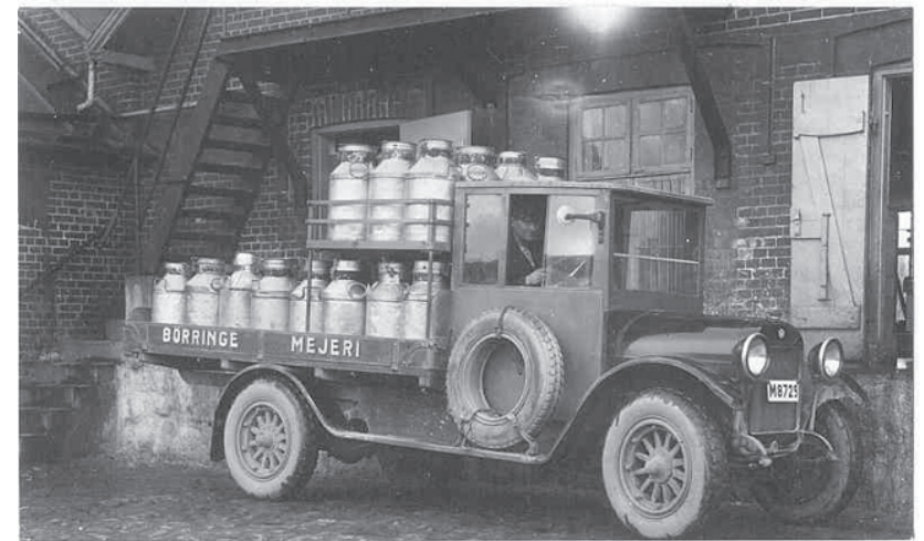
För intresserade av mjölk och fordon visar vi en bild ur Martin Svenssons fotosamling som nämndes i förordet. Lastbilen tillhörde Börringe Mejeri och är tagen omkring 1930.