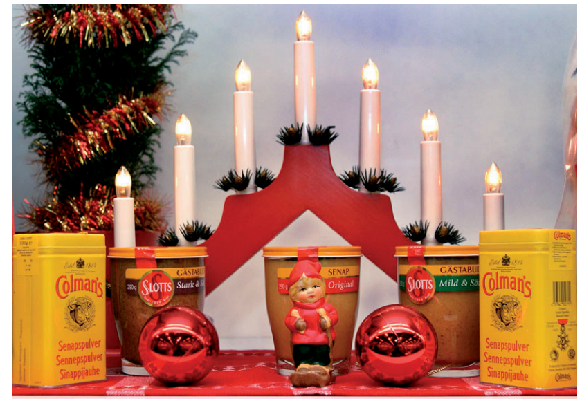
Senapsaltare i Eslöv julen 2004.

En redovisning av det gemensamma projektet kommer att ske under hösten i form av en mindre rapport. Alla medverkande arkiv kommer där att beskriva någon del av sin dokumentation: Folklivsarkivet, Nordiska museet, Språk- och folkminnesinstitutet i Uppsala (SOFI), Dialekt-, ortnamns- och folkminnesarkivet i Göteborg (DAG), Dialekt-, ortnamns- och folkminnesarkivet i Umeå (DAUM), Göteborgs stadsmuseum och Mångkulturellt centrum i Fittja. Planer finns också för en gemensam bok där såväl de som medverkade vid dokumentationen som andra författare deltar.