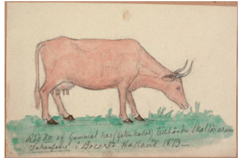
Röd ko af Gammal ras (geten kallad) tillhörde skolläraren (...) i Breared Halland 1873. Mandelgren 2:3-26:48.

e-post: hakan.jonsson@etn.lu.se adress : Håkan Jönsson, Etnologiska institutionen, Finngatan 8, 223 62 lund