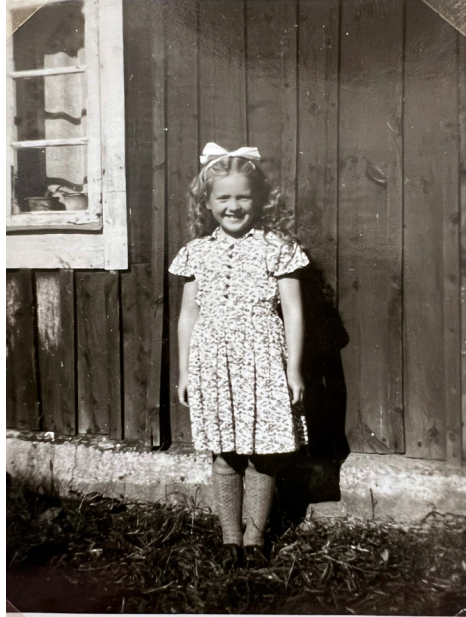
Att få tyg i present var vanligt förr. När tyget sytts upp var det mer eller mindre obligatoriskt att bli fotograferad i det nya plagget så att ett tack kunde skickas till givaren. Här syns en glad meddelare, f. 1942, i en klänning av småblommigt presenttyg. Lendahls.

Mamma och pappa brukade ge mig klänningstyger i present när jag fyllde år ibland och jag kände mig mer eller tvungen att sy. (Möller, f. 1936)