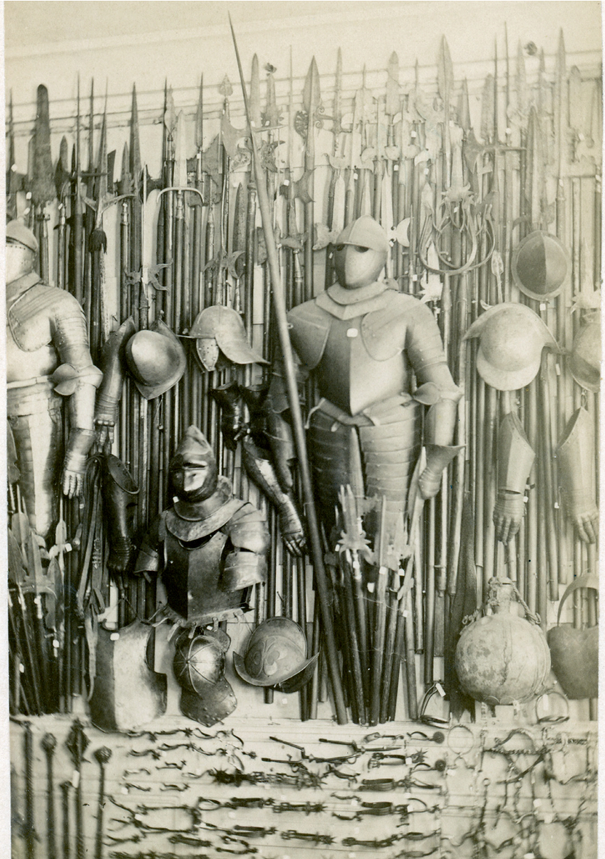
Vägg med vapen och rustningar i Hammers museum 1870.