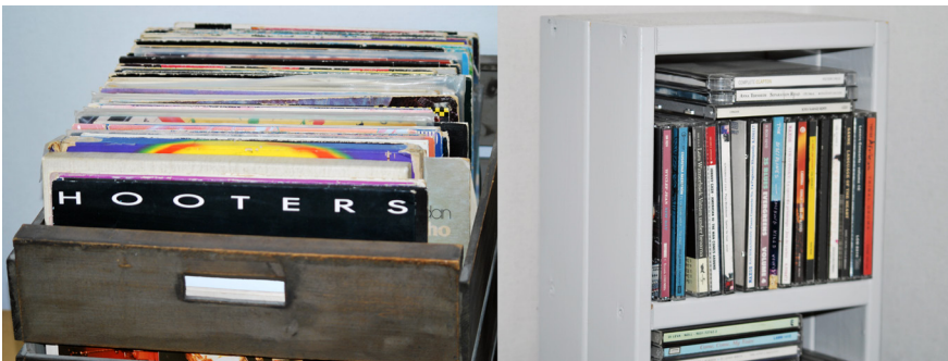
Vinylskivor (LP) respektive cd-skivor hemma hos undertecknad (montage). Foto: Patrik Sandgren, 2018.

En kvinnlig besökare i Bengans skivbutik i Stockholm säger att "Jag växte upp med att lyssna på lp-skivor. Min pappa hade alltid kvar skivspelaren så det har blivit naturligt för mig att lyssna på vinyl" (Björklund 2016). En manlig besökare i samma affär försöker hitta en förklaring till vinylskivans nyvunna popularitet i jämförelse med cd-skivan: "Det är så mycket mer med att hålla i en vinylskiva. Man kan vända på den och läsa