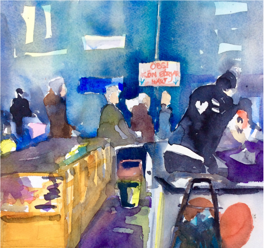
Akvarell av Cecilia Fredriksson

begagnatmarknaden med sina unika erbjudanden en attraktiv destination. Men den ofta röriga och oförutsägbara marknaden kräver en speciell organisation. Det handlar om att skapa ordning och göra destinationen och butikens erbjudanden överblickbara. Flera secondhand- och bilståndsbutiker genomgår för närvarande ett slags reningsbad och organiserar sitt utbud på ett sätt som alltmer kommit att likna de traditionella butikernas. Här blir butiken en resurs för kreativt skapande och återvinning, en praktik som allt oftare också marknadsförs i sociala medier. Att ha servering är också ett allt vanligare inslag.