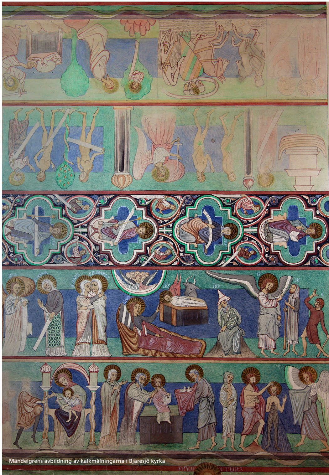
Mandelgrens avbildning av kalkmålningarna i Bjäresjö kyrka