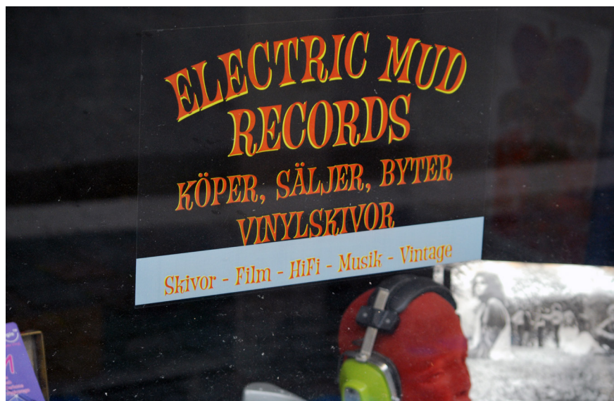
Electric Mud Records i Ängelholm (SMS 369).

Både frågelistorna LUF 197 från 1996 och LUF 248 från 2017 erbjuder möjligheter att formulera och undersöka flera frågeställningar, men begränsningarna i Upptecknarens omfång har fått sätta ramar för den här artikeln. Mitt huvudsyfte efter avgränsning är att försöka få en uppfattning om förhållandet till just cd- och vinylskivan. 2 Ett syfte är också att jämföra svaren från den nya och gamla frågelistan och undersöka om olika