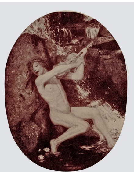
Strömkarlen, 1884. Olja av Ernst Josephson (1851-1906). Omslag till Lothigius En bakgrund till Näckens polska, 1914.

I äldre tider sågs inte sällan spelmannen som en dubbelnatur. Denne, oftast en man i beskrivningarna, var på många sätt en omtyckt figur som kunde underhålla allmogen och spela till dans, bröllop och gillen. Musik och dans var samtidigt kopplad till hängivelse och lust och spelmannen kunde därför lätt bli förknippad med synd och skam. Ibland ansågs även spelmannen ha kunskaper i svartkonst och annan fördold kunskap.