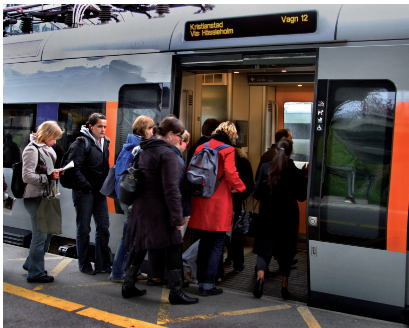
Morgonpendlare.

Dokumentationen, som har finansierats med medel från Ebbe Kocks Stiftelse och skedde inom projektet ”Minnen, upplevelser och berättelser om vardagsresor”, redovisas i rapporten ”Känna sig hemma” Pendlarens vardagsstrategier. Den kan läsas i sin helhet på Folklivsarkivets hemsida: http://etnhum.etn.lu.se/arkiv/ .