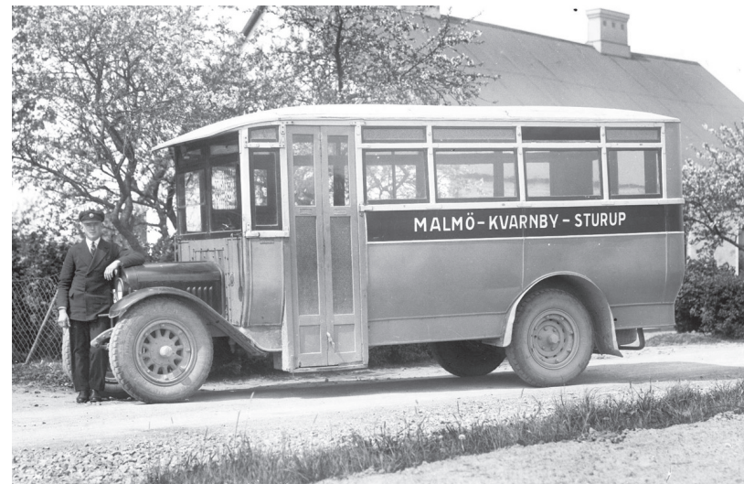
Chaufför vid bussen Malmö - Kvarnby - Sturup på 1920-talet. Neg.nr 8-9-68.

snabbt slut när en av pojkarna tappade sin mössa och lärarinnan ilsknade till. Under en skolresa till Lund på 1950-talet pratade och skrattade skolkamraterna för fullt och sjöng följande sång så det ekade i bussen: "En busschaufför, en busschaufför. Det är en kis med glatt humör. Och har han inget glatt humör, så är det ingen busschaufför."