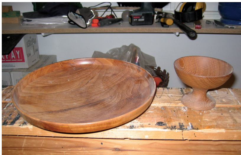
Svarvade skålar av trä.

I svaren finns många berättelser om föremål tillverkade av trä och den betydelse berättaren tillmäter dem. Det är föremål gjorda av en speciell person, av ett speciellt träd eller av ett speciellt träslag. ”För många år sedan fick jag en ordförandeklubba i present” skriver en man och fortsätter: ”Ordförande i byggnadsnämnden hade själv svarvat skafvet av virke från en björk och klubban av gullregnsträd, som båda vuxit på hans föräldragård vid stranden av Torne älv. Det är den särklassigt finaste gåva jag någonsin fått.”