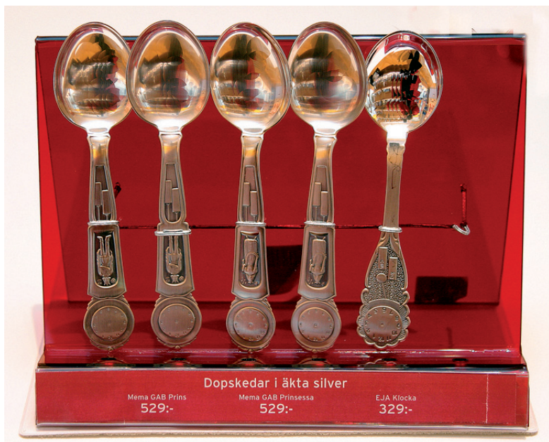
Dopskedar i äkta silver.

Bland svaren på Livets högtider finns såväl korta som långa berättelser. Vissa har valt att berätta om samtliga de tre livsritualer projektet fokuserar liksom om någon ytterligare ritual som efterfrågas under rubriken "Andra livshögtider". Andra har valt att berätta utförligt om en ritual. I flertalet svar ligger fokus på ritualer som man deltagit i under senare år men en del har valt att kontrastera dessa upplevelser med minnen från tidigare erfarenheter. En kvinna väljer till exempel att redogöra för och jämföra sin dotters bröllop med sitt eget som hölls 25 år tidigare. Andra jämför begravningar de nyligen deltagit vid med sådana de minns från ungdomsåren. Mycket är annorlunda idag och av svaren framgår att förändringarna kan uppfattas både som positiva och negativa.