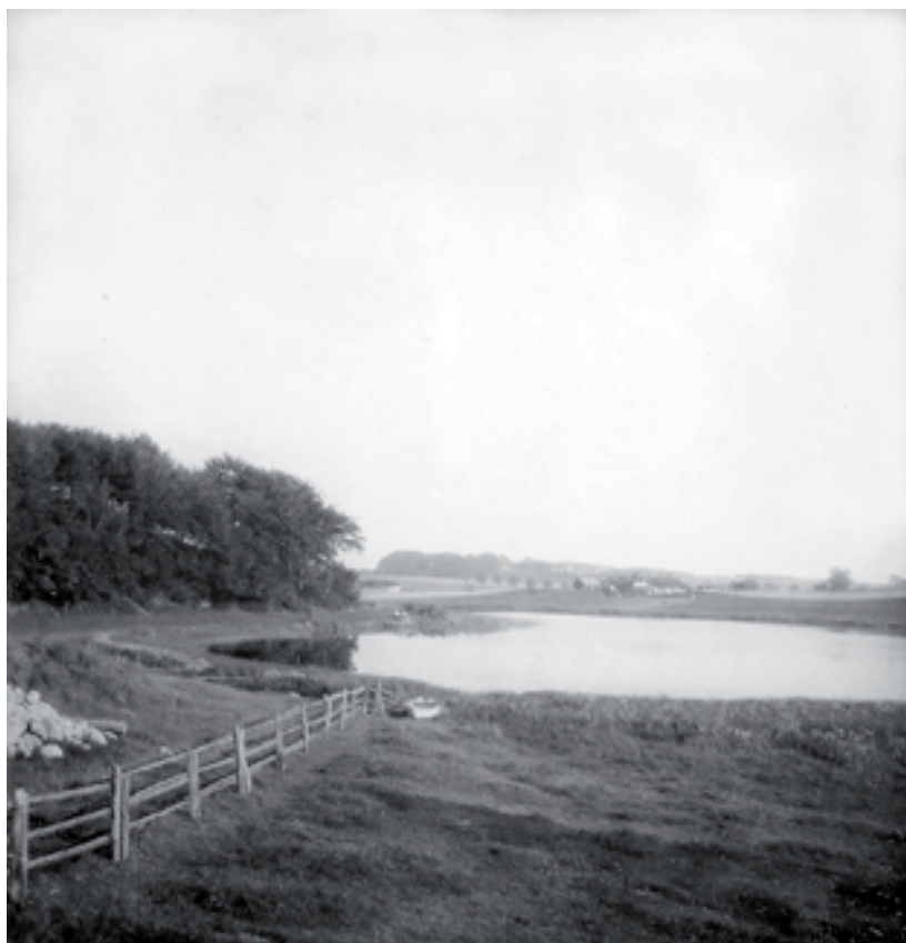
Vemmenhögskärs härad. 1931.

Vattengroparna hade inga genomgående vattendrag. Fisksorter som mört och rudor överlevde ofta vintern under istäcket. Andra fisksorter var känsligare och därför måste gravarna skötas som dammar om fisken inte skulle dö under vintern. Lufthål slogs upp i isen och hölls öppna med en stor långhalmskärve. Dessutom planterades ”Söfve böstor”, dvs. lavendel i strandkanten för att ordna luftväxling vid iskanten.