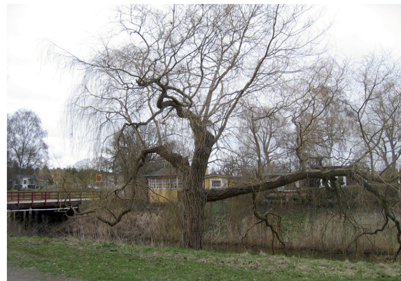
Centrala Landskrona.

Intervjun med trädingenjören var den första jag överhuvudtaget gjort och jag var mycket nervös innan jag kom till Parkkontoret, men det släppte när samtalet kom i gång. Detta skulle sedan skrivas ut ord för ord. Intervjun var ungefär 30 minuter lång och borde inte ta särskilt lång tid att skriva ut, högst någon timme trodde jag. Det tog två arbetsdagar. Jag och Charlotte pratade om att det vore bra att inte intervjuas enbart trädingenjörer utan också arkitekter och andra kommunala grupper som sysslar med träd. Idén till detta kom när jag pratade med trädingenjören i Landskrona. Jag ställde några frågor om trädbudget och han sa att det var nog bäst om jag pratade med deras stadsarkitekt, eftersom han i detta fallet hade större inblick i ekonomin.