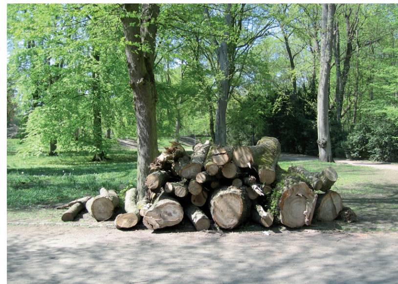
Stadsparken i Lund.

då det enda jag hittade var en hög uppsågade träd och några döda grenar i träden lite varstans.