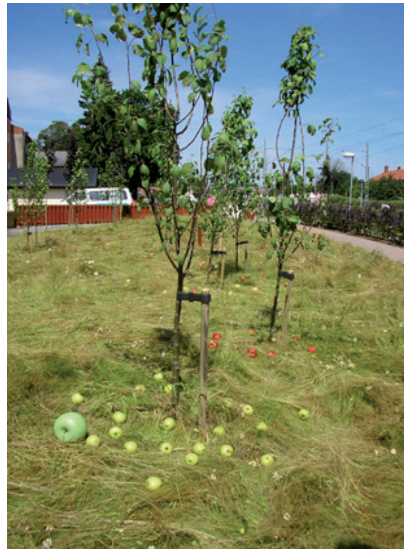
Äppelträd i Tomelilla.

Frukträd förekommer i riklig mängd i berättelserna och framstår som närmast självklara inslag i trädgården. Förutom speciella klätterträd är det ofta fruktträd det berättas om i samband med träd man minns från barndomen. Ett skäl kan vara att de talar till och erfars med samtliga sinnen. Minnena handlar om såväl hur de såg ut och kändes som om hur blommorna doftade och löven susade. Till det kommer minnena av hur äpplena, päronen, plommonen eller körsbären smakade. Trädet kan bli en symbol för en svunnen tid till vilken känslor av gemenskap och tillhörighet knyts.