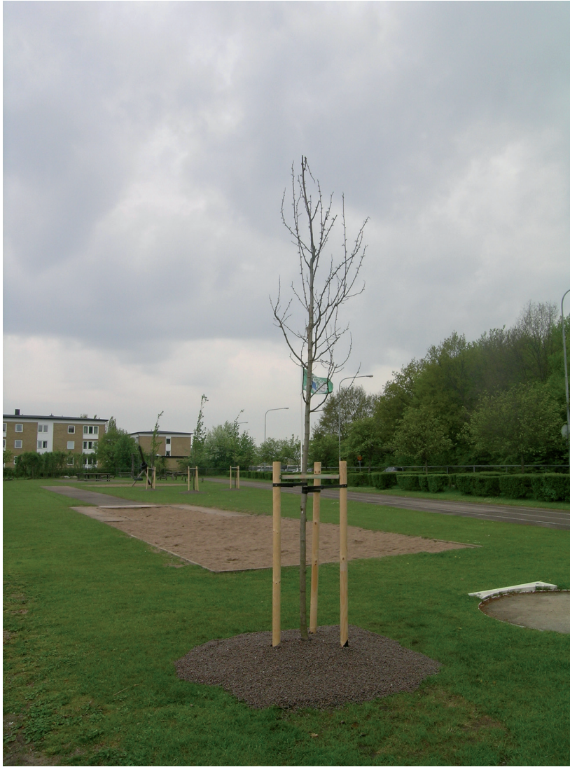
Nyplanterat träd på skolgård i Helsingborg.