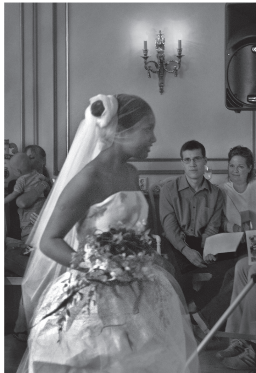
Visning av bröllopsklänningar.

hela materialet i form av samtliga frågelistsvar utgångspunkten. Genom att läsa en mängd berättelser och tankar kring samma ämne utkristalliserar sig mönster och teman som återkommer på olika sätt i de flesta svar och därför framstår som särskilt centrala.