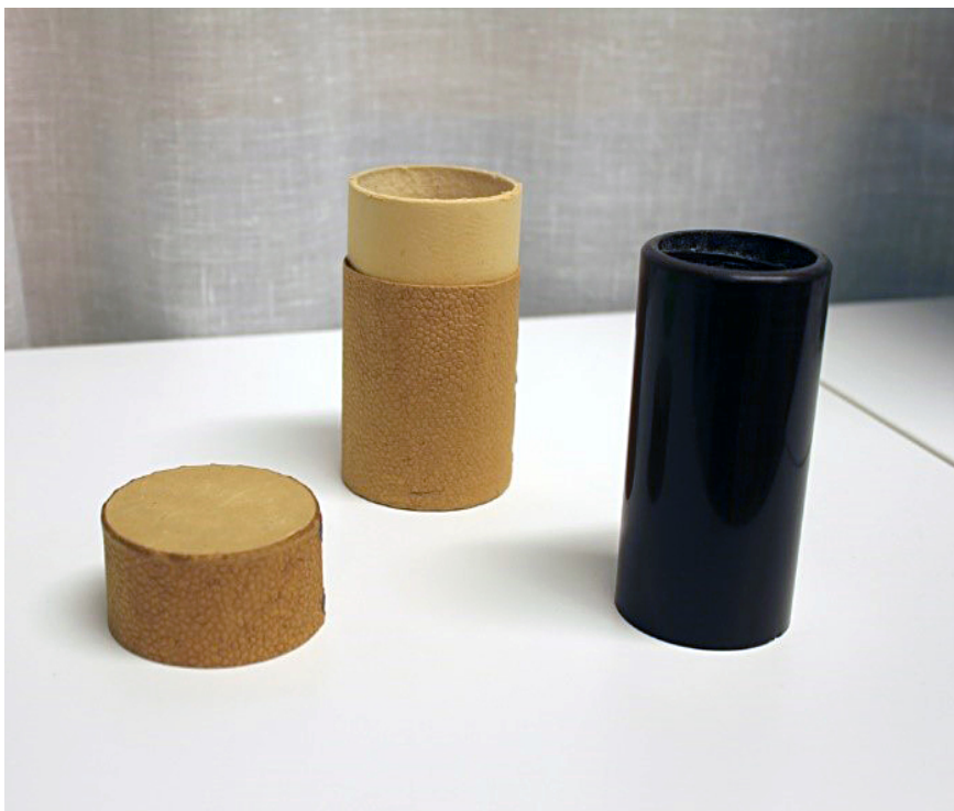
Fonografrulle med etui. Utställningsobjekt på Arkivens dag 2012.

Att nu merparten av Lunds kommuns arkiv samlas under samma tak innebär att nätverken mellan arkiven har möjlighet att vidgas. Det lär till detta bli smidigare att samordna de olika arkivtjänsterna när också en mängd arkivmaterial tillgängliggörs på ett och samma ställe. Till detta torde ett samlat centrum inrymmande Riksarkivet betyda att mindre arkiv får lättare att exponera sin verksamhet för vidare målgrupper, som till släktforskare. Utan att kunna redovisa till utförd statistik, har åtminstone musiksamlingarna redan iakttagit en viss utvidgning av verksamheten till följd av flytten. Detta märks tydligt i fler förfrågningar, fler önskemål om föredrag och visningar jämte ytterligare samverkan med de övriga arkiven. Ett exempel på det senare är musiksamlingarna bistått med teknisk assistans och kompetens inom det multimediala området.