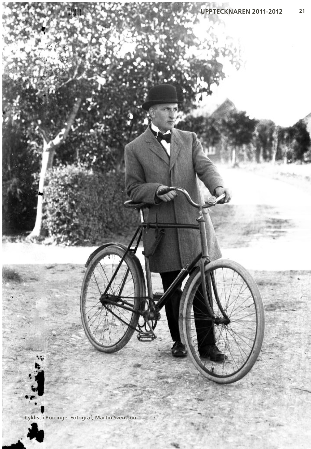
Cyklist i Börringe.