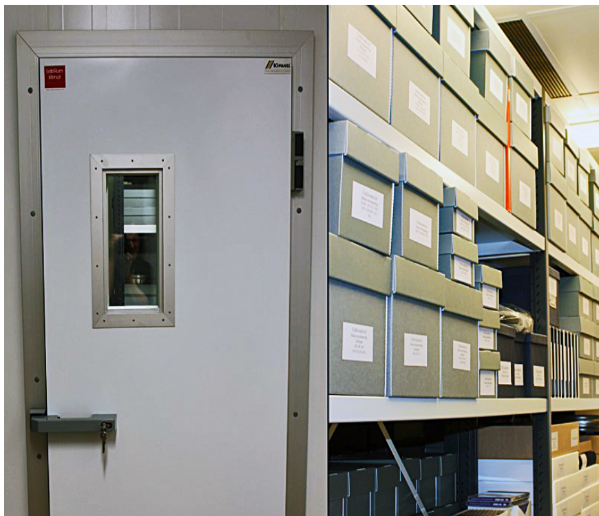
Klimatarkivet på Arkivcentrum Syd. Lund 2013.

Även merparten av musiksamlingarnas registrerade visböcker, vistexter, skillingtryck samt övriga dokument har skannats under tidrymden och finns nu tillgängliga i pdf-format. Detta betyder att huvuddelen av samlingarnas totala mängd registrerade material nu finns att tillgå som