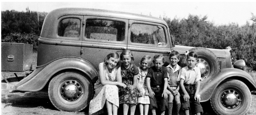
Amerikansk bil från slutet av 1930 med framtidens bilförare på fotsteget.

Intresset för biltrafiken blev så småningom allt större. Vid de folkfester som sedermera anordnades i städer, köpingar, samhällen och på landsbygden, ingick det biltrafik i festprogrammet och biltrafiken vid dessa fester var så enorm så att bilen gick utan uppehåll