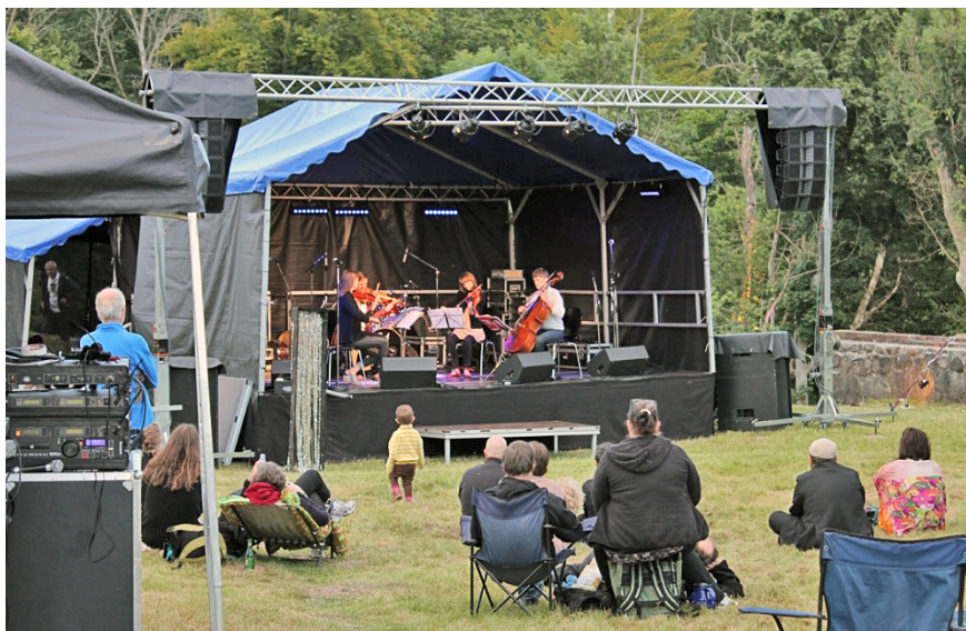
Musik vid Vattenmöllan. Hækkeberga kvarnruin 2012.

med digital inspelningsteknik. Under hösten medverkande jag för musiksamlingarnas räkning på en av två arrangerade kvällar, närmare bestämt den i Klippans hembygdsgård. Som ett förberedande till projektet gjorde arkivarierna en studieresa tillsammans med representanter från Skånes hembygdsförbund ; en resa som gick med buss till sagomuseet i Ljungby, Småland.