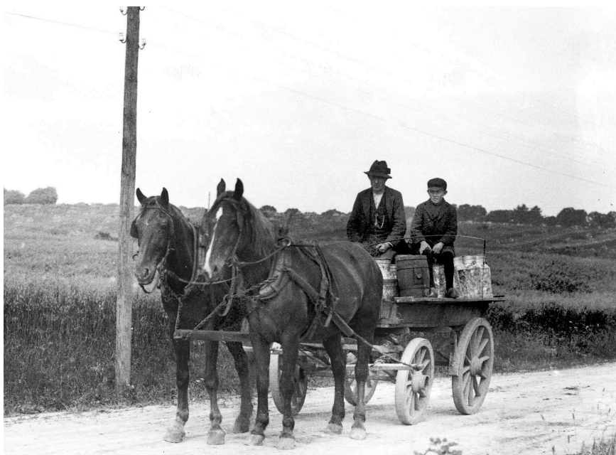
Hästskjuts från Börringetrakten i Skåne.

svarade att kärringen är det ingen fara med men vagn och sele gick i småbitar. Det var ju tråkigt sade jag men hade ni hållit i hästen hade detta aldrig skett. Jag har lovat er hustru att betala doktorn men vagn och sele får ni själva reparera.