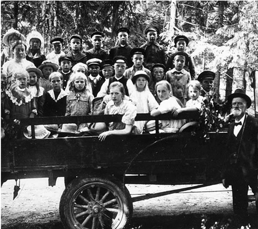
Torestorp, Västergötland. Barnens första skolresa med bil år 1926.

framför bilen och tjöt och skulle sätta hornen i bilens kylare. Jag satte högsta rus på motorn och signalerade så motorns dån och bilsignalen instämde med tjurens vrål och situationen såg ganska hotande ut men efter den starka pressning som motorn blev utsatt för började vattnet koka i kylaren och spruta ut genom påfyllningsproppen och några droppar kokhett vatten föll på tjurens nos som då gav till ett illvrål och tog ett hopp i väggkanten. Då passade jag på att köra fram med bilen så vi fick tjuren efter oss men tjuren sprang efter bilen och försökte ta bilutflykten på hornen men jag satte högsta fart på bilen och tjuren måste uppge striden. Hade damen ej fått hjälp i rätta ögonblick hade säkert en allvarlig olycka inträffat och damen blivit ihjälstågad av tjuren.